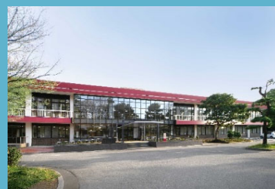
中央図書館 図書館総務係 学術情報係 資料管理係 資料サービス係

知の共有及び知の創出が大学図書館に求められる今、鳥取大学附属図書館は今後も本ビジョンに掲げた目標達成の取り組みを進めていきたい。