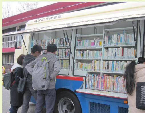
鳥取キャンパスを巡回する鳥取市立図書館の移動図書館車

■SDGsの推進 SDGs目標4「質の高い教育をみんなに」を達成するため、地域に開かれた図書館として資料と環境を提供する。