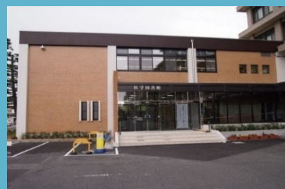
医学図書館 医学情報係

2022年4月発行 鳥取大学附属図書館 680-8554 鳥取市湖山町南4丁目101