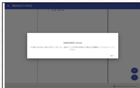
試し読み画面イメージ