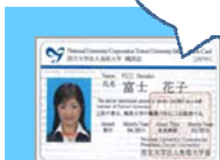
ICカード職員証・見本