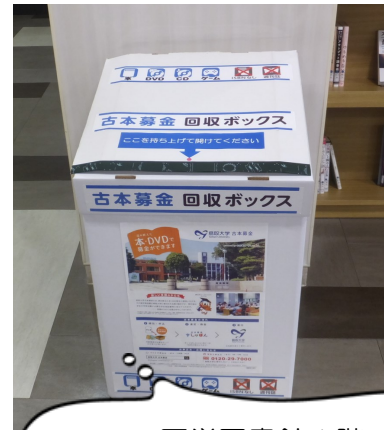
医学図書館1階 階段横にあります！

ご自宅や研究室に不要な本、DVD、ゲーム機などがございましたら、ぜひご利用ください！