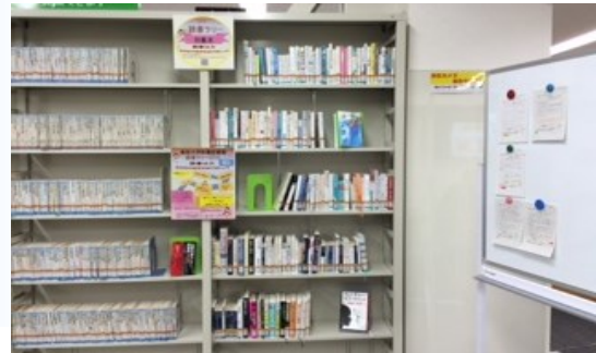
図書ラリー対象本コーナーのジャンルは様々 (図書館2階)