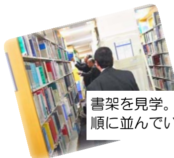
書架を見学。本は分類 順に並んでいます