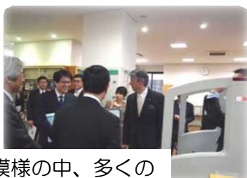
雨模様の中、多くの 関係者の方にお集まり 頂きました