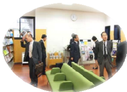
館内では唯一軽食OK!の ブラウジングコーナー