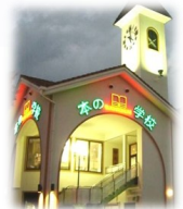
今井書店 本の学校

お忙しい中参加いただいた学生さんにつきましては、本当にありがとうございました。 次回も多数の学生さんのご参加、お待ちしております。