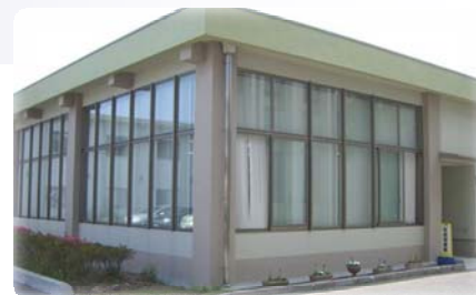
* 仮設図書館です *

蔵書冊数約4,000冊、座席数50席という、こじんまりとした図書館ですが、新館オープンまでどうぞご利用ください。