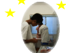
人体模型を組み立てる