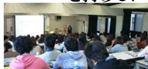
出張図書館の様子