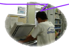
文献複写の実習風景