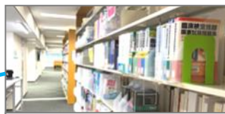
国家試験・CBT対策関係コーナー