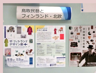
鳥取民藝とフィンランド・北欧 (1F展示ケース横)