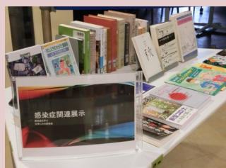
感染症関連展示 (1Fホール)