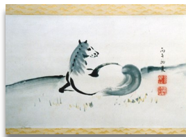
池田藩第10代藩主慶行（1941-48在位）による愛馬の画。14才の時の画だそうです。

1階の展示ケースでは、旧鳥取師範学校の所蔵資料をはじめとする貴重資料・郷土資料を展示しています。9月から展示している、秋らしい資料をご紹介します。