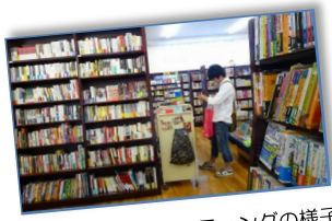
前回のブックハンティングの様子